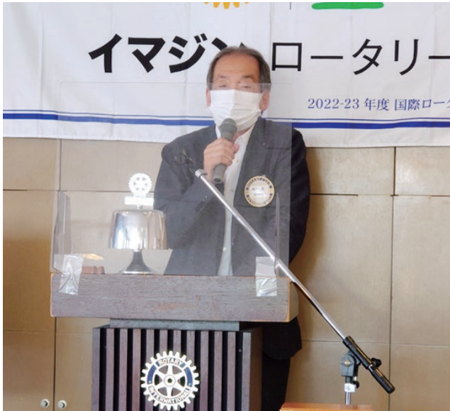
織戸奉仕プロジェクト統括委員長 活動方針・計画発表